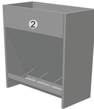
Autokarmnik paszowy PIV